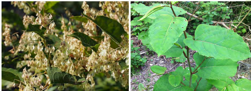
Ci-dessus, de la renouée du Japon

Elle se propage rapidement et produit des composés chimiques toxiques qui empoisonnent les racines des autres plantes. Pour l'éradiquer, il faut détruire le plant sur place, car déplacer les branches répèndrait de toutes parts les graines de la renouée. C'est pour cela que le personnel communal a autorisation de les brûler directement.